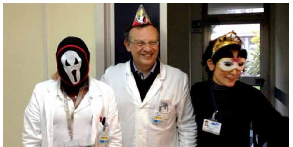
Il Carnevale con i bambini, i medici e i volontari dell'Unità Operativa di Radioterapia Pediatrica dell'Ospedale San Giovanni di Dio e Ruggi d'Aragona di Salerno